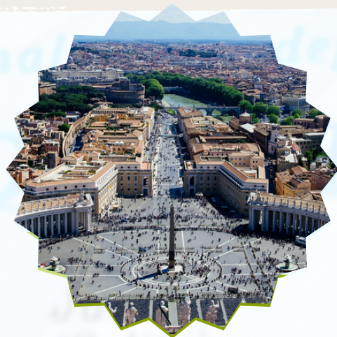
Piazza San Pietro